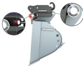
Sbloccato per il processo di attacco. Il perno indicatore è esteso.