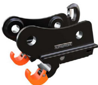
KHS21L+ qui con il gancio

Il set è composto da: attacco rapido idraulico con arresto anticaduta e indicatore di blocco sicuro