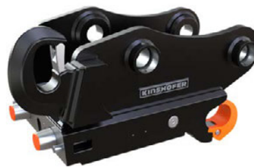
KHS10L qui con il gancio