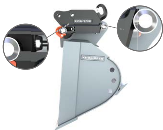
Bloccato in maniera sicura. Il perno indicatore viene spinto verso l'interno.

Il set è composto da: attacco rapido idraulico con arresto anticaduta e indicatore di blocco sicuro