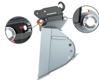
Bloccato non correttamente I perni di blocco si trovano oltre l'intervallo concesso. Il perno di blocco è esteso.