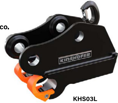
KHS03L qui con il gancio

Gli attacchi rapidi idraulici KHS+ sono caratterizzati da standard di sicurezza estremamente elevati. L'arresto anticaduta (artiglio dell'attacco rapido esteso) impedisce le cadute dell'accessorio se il blocco dell'attacco rapido è stato inavvertitamente agganciato in maniera non corretta. Per aumentare ulteriormente la sicurezza, l'attacco rapido KHS+ è stato anche dotato di un nuovo indicatore di blocco sicuro, il quale indica in maniera affidabile la chiusura corretta. Totalmente conforme a tutte le normative di sicurezza applicabili delle direttive per le macchine 2006/42/EG, DIN EN474-1, ISO13031 e SUVA.