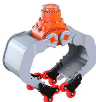
en option: 4-Grip, ici avec A06HPX