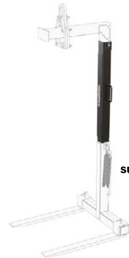
su KM 414