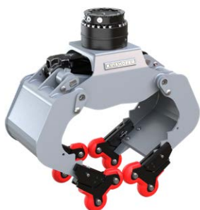
optionale 4-Grip Ansteckvorrichtung, hier angebaut an einem A04H